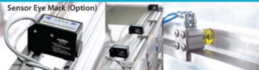
Sensor Eye Mark (Option)

Energy Saving and High Technology Performance